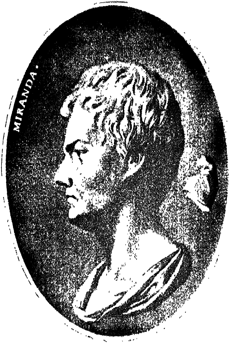
फ्रांसिस्को दे मिरांदा